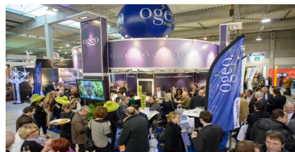
Photo : Salon des mandataires du 13 février 2014

Chaque année, OGEO FUND participe au Salon des Mandataires du WEX de Marche-en-Famenne. Cet événement est le rendez-vous incontournable des pouvoirs locaux, mais également de tous ceux qui participent à la gestion des Communes, des Provinces, des Centres Publics d'Action Sociale (CPAS) et des Intercommunales de la Région Wallonne. OGEO FUND sera à nouveau présent lors de la prochaine édition, le 12 février 2015.