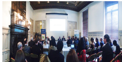
Photo : Table ronde du 15 octobre 2013

Le 25 novembre, OGEO FUND organisera une table ronde intitulée « Les Belges et leur pension : objectifs et moyens pour une réforme viable ». La conférence fera intervenir un panel d'experts de haut niveau issus du monde politique, académique, associatif et professionnel. A cette occasion sera présentée l'enquête OGEO FUND-IPSOS sur l'attitude des Belges à l'égard de leur pension, suivie par une discussion sur les recommandations du rapport de la Commission de réforme des pensions. Cet événement poursuit la démarche volontariste d'OGEO FUND de soutenir la recherche sur les systèmes de pension. En 2013, OGEO FUND avait déjà commandité une étude auprès de la Section belge du CIRIEC (Centre International de Recherches et d'Information sur l'Economie publique, sociale et coopérative) et de l'Université de Liège sur le financement des pensions du personnel des administrations provinciales et locales en Wallonie et à Bruxelles.