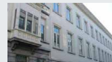
Lakenwevers Vastgoedcomplex aan de Lakenweversstraat te Brussel.

Kantoren: 15 500 m 2 - Opslagruimte: 1 300 m 2 - Parking: 157 plaatsen - Huurder: VDAB (huurovereenkomst van 18 jaar sinds 2010).