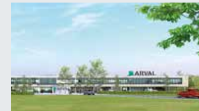
Zaventem Building of "Arval-gebouw" Het Integrale Zaventem-gebouw bevindt zich in het Ikaros Business Park te Zaventem.

De vastgoedbeleggingen van OGEO FUND zijn (hoofdzakelijk) bestemd voor verhuur en zijn geografisch over heel België verspreid. Eind december 2011 bedroegen de vastgoedinvesteringen in totaal 59 miljoen euro. Het rendement belooft ongeveer 6 %.