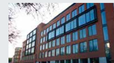
Waterside Vastgoedcomplex aan de Willebroekkaai te Brussel.

Kantoren: 6 628 m 2 - Archiefruimte: 518 m 2 - Parking: 55 plaatsen - Huurder: Europees Defensie-agentschap (huurovereenkomst van 13 jaar sinds 2011).