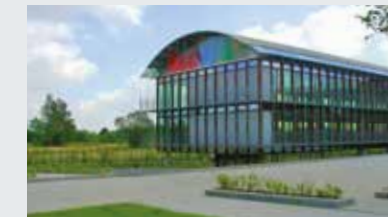
Nivelles Porte de l'Europe Een te Nijvel gelegen gebouwencomplex dat door het architectenbureau Samyn en Partners werd ontworpen.

Kantoren: 4 700 m 2 - Werkplaatsen: 500 m 2 - Parking: 600 plaatsen - Huurder: Arval (huurovereenkomst van 9 jaar sinds 2010).