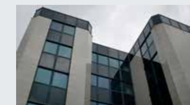
Copernicus Vastgoedcomplex aan de Copernicusstraat te Antwerpen, tegenover het station.

Kantoren: 4 500 m 2 - Werkplaatsen: 500 m 2 - Parking: 77 plaatsen - Huurders: Acerta Middelen Beheer (huurovereenkomst van 9 jaar sinds 2008), Idewe (huurovereenkomst van 9 jaar sinds 2008), Waals Gewest (huurovereenkomst van 9 jaar sinds 2010).