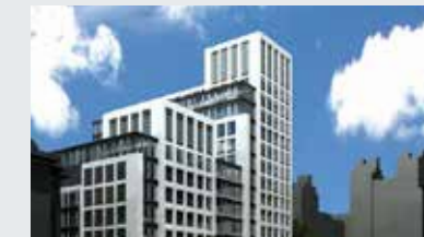
South City Office Fonsny Twee gebouwen aan de Fonsnylaan te Brussel.

Kantoren: 8 000 m 2 - Archiefruimte: 4 000 m 2 - Parking: 289 plaatsen - Huurders: Holcim (huurovereenkomst van 9 jaar sinds 2010), Federale Politie (huurovereenkomst van 18 jaar sinds 2010), Waalse Overheidsdienst (huurovereenkomst van 9 jaar sinds 2010), FOD Justitie (huurovereenkomst van 9 jaar sinds 2010).