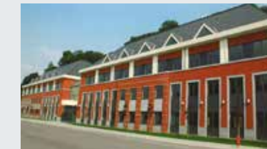
Arsenal Building Een gebouw aan de Ancienne Chaussée de Liège te Jambes.

Totale oppervlakte: 14 180 m 2 - Parking: 73 plaatsen - Huurders: Mehewane (huurovereenkomst van 9 jaar sinds 2010), BMSTECH (huurovereenkomst van 18 jaar sinds 2010), Smals VZW (huurovereenkomst van 9 jaar sinds 2010).